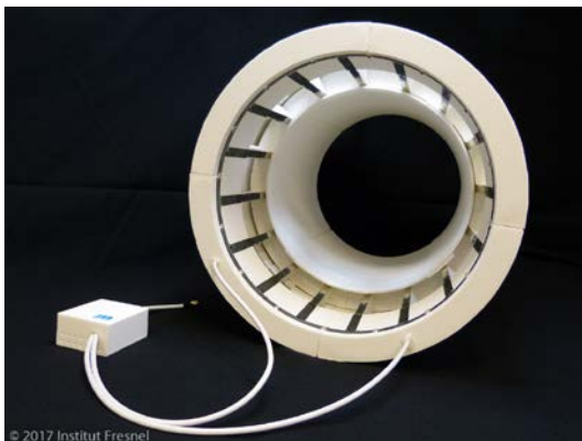
Figure 1 : antenne émettrice pour IRM ultra haut champ (7 Tesla) pour la tête ; brevet copropriété du CNRS, d'Aix-Marseille Université, de l'Ecole Centrale Marseille et du Commissariat à l'Energie Atomique. HD sur demande.